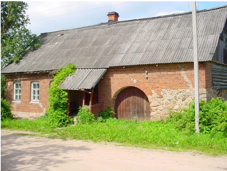
Дом постройки начала XX века, фото 2004 г.