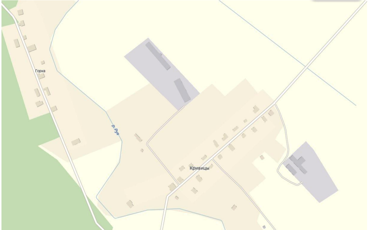
Кривицы на карте в Интернете.

https://yandex.ru/maps/?ll=28.153590%2C59.003881&utm_source=geoblock_maps_slancy&z=16.65