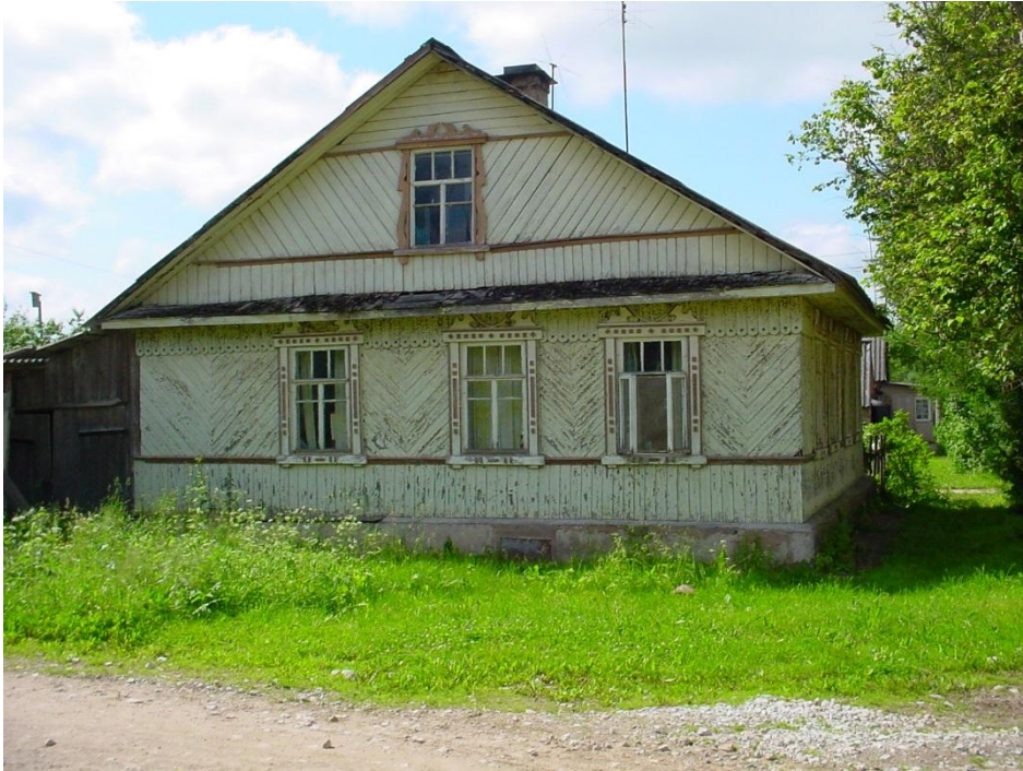
Дом в Кривицах, фото 2004г.