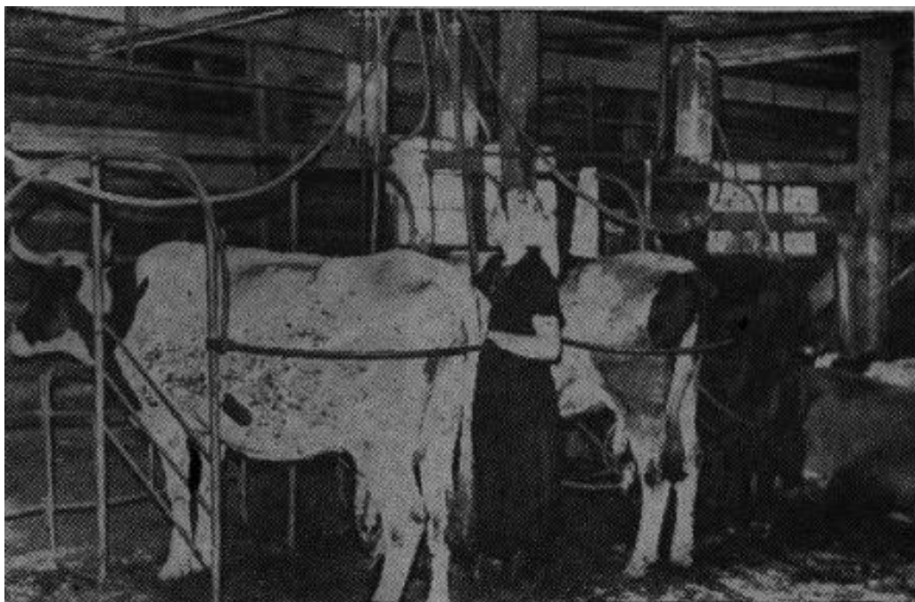
На кривицкой молочно-товарной ферме колхоза «Май», фото в газете 1960 года.