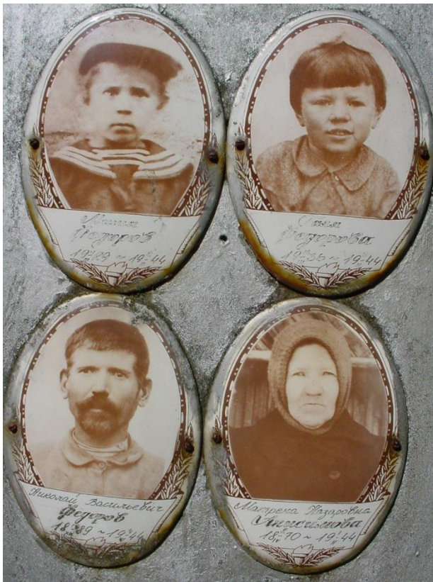
Надгробие семьи Федоровых на кривицком кладбище, фото 2004г.